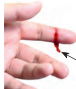
die Schnittwunde cut