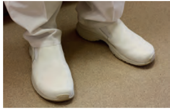
die Arbeitsschuhe work boots