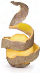
die Kartoffelschalen potato peel