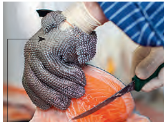
die Stechschutzhandschuhe stab protection gloves