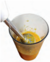
pürieren to puree