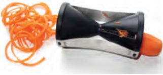
in Spiralen schneiden to cut into spirals