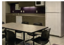
der Sozial- raum staffroom