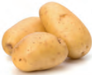
die Kartoffel potato