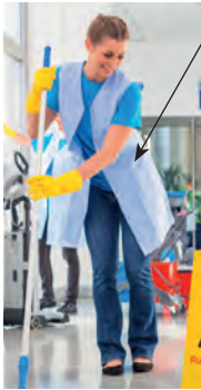
der Kittel work coat