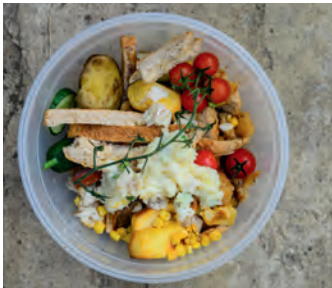
der Bio-Abfall organic waste