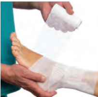
der Verband first-aid kit