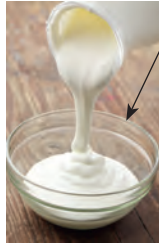
plate dish _____