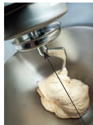
Teig kneten to knead dough