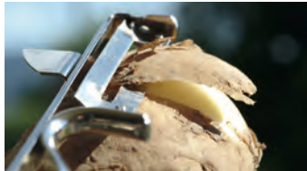
schälen to peel