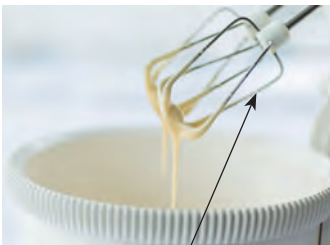
Teig rühren to stir dough