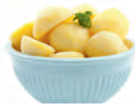
die Salzkartoffeln boiled potato