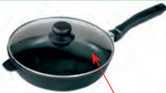
der Pfannendeckel pan lid