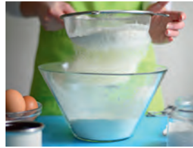
sieben to sieve