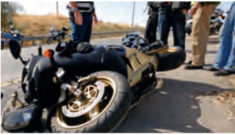
der Unfall accident