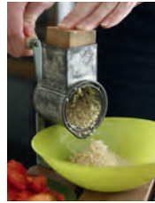
mahlen to grind