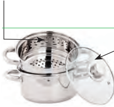
der Deckel lid