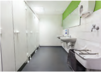
die Sanitärräume washrooms