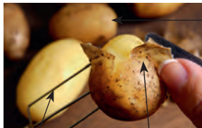
der Dreispiß tork with three prongs pellen to skin