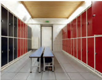
der Umkleieraum changing room