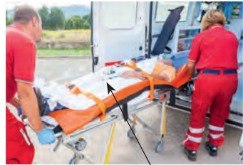
der/die Verletzte/r injured person