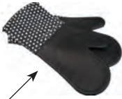
der Ofen- handschuh oven cloth