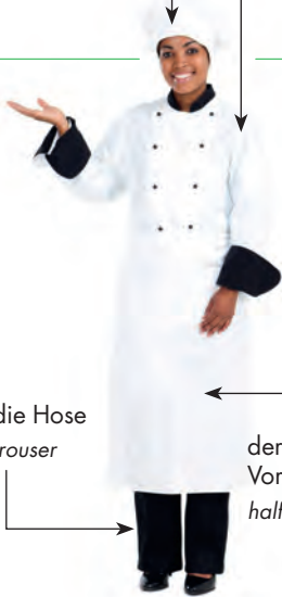
die Hose trouser