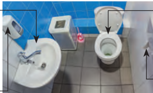
die Toilette/das WC toilet