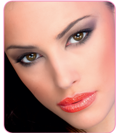
Make-up für ein Farbfoto

Die Lippen mit einem kühlen dunkelroten Konturenstift umrahmen und mit mittel- bis dunkelrotem Lippenstift ausfüllen. Lippen anschließend mit Puder mattieren. Auf Rouge wird eher verzichtet.